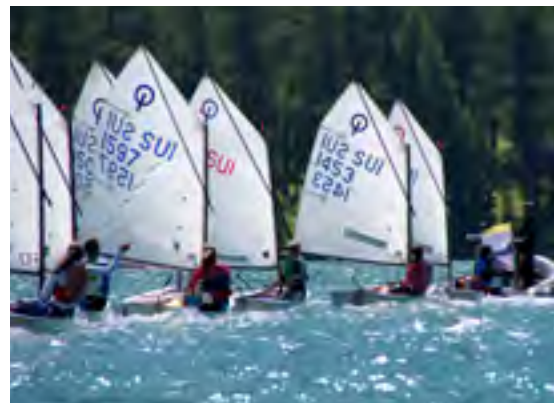
Training Silser Woche